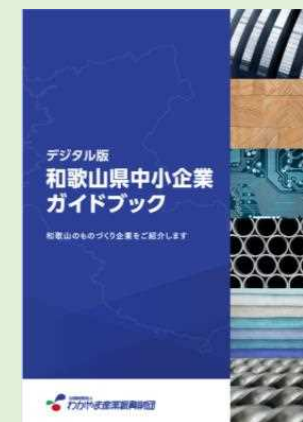
和歌山県中小企業WEBガイドブック